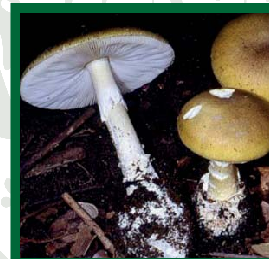
Gyilkos galóca (mérgező)

A Kamaraerdő fás erdőtársulása alapvetően kocsánytalan tölgyből ( Quercus petraea ), csertölgyből ( Quercus cerris ), mezei juharból ( Acer campestre ), magas kőrisből ( Fraxinus excelsior ) és kislevelű hárs ( Tilia latiphyllos ) fajokból áll. Kétszázkilencvennégy faj előfordulását bizonyították, melyek közül kilenc védett .