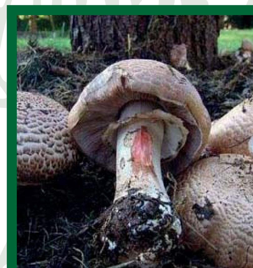
Lomberdei csiperke (ehető)