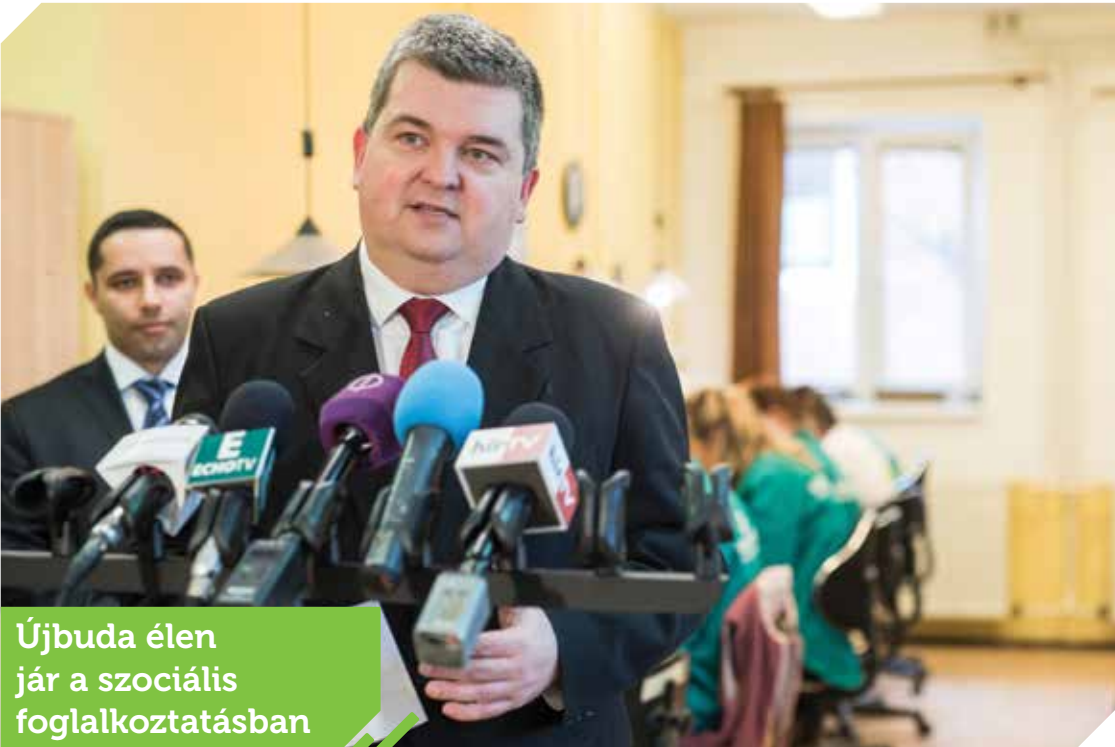
Újbuda élen jár a szociális foglalkoztatásban

nyen kiemelte: a kerület élen jár a szociális foglalkoztatásban. A 100 százalékos önkormányzati tulajdonban lévő Újbuda Prizma Közhasznú