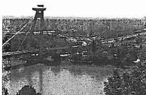
Pozsonyligetfalu panelházai a Duna-híddal