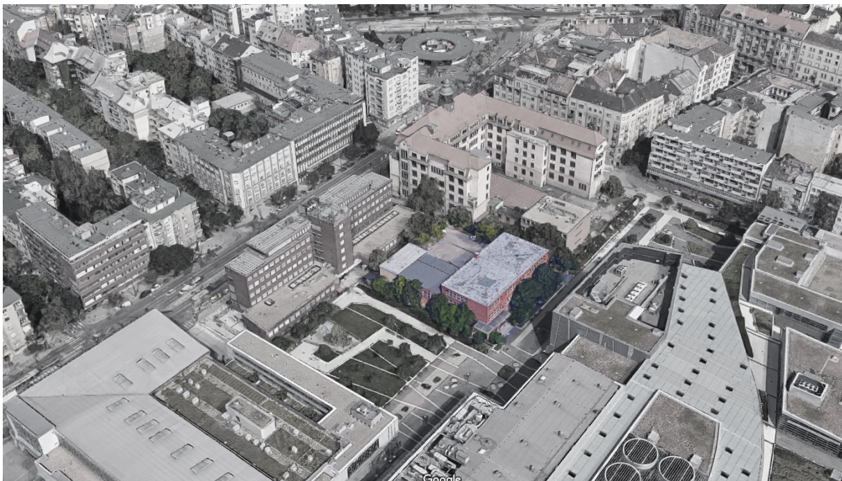
Az érintett telek és épület légifotón

Az előzetes elképzelések alapján a meglévő épület Kőrös József utca felé eső F+2 szintes része megmarad, s egy szint ráépítéssel bővülne. Ebben az épületrészben kerülnének kialakításra az egészségügyi funkciók. A kialakított fásított köztér északi térfalaként tervezett új épületrész földszintjén térre nyíló közösségi szolgáltatási funkciókhoz köthető területek kerülnének kialakításra, míg e felett a lakófunkciók. A szomszédos Szent Kristóf rendelőintézet irányába egy fedett, zárt összeköttetés kialakítása is tervezett a funkciók