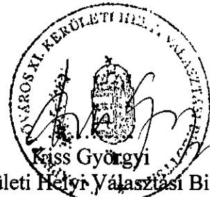
a XI. Kerületi Helyi Választási Bizottság elnöke