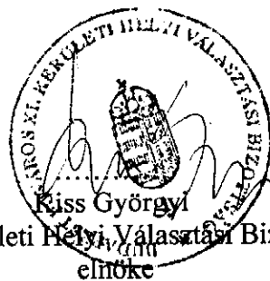
a XI. Kerületi Helyi Választási Bizottság elnöke