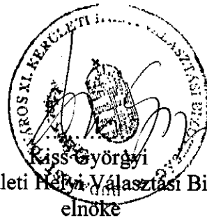
a XI. Kerületi Helyi Választási Bizottság elnöke