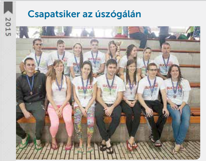
Csapatstíker az úszógálán

Harmadik lett a Budai XI. SE Triatlon Szakosztálya az idén 9. alkalommal megrendezett 24 órás úszógálán Dunaújvárosban. Az eredményért a 16 újbudai versenyző több mint 108 kilométert teljesített egy nap alatt.