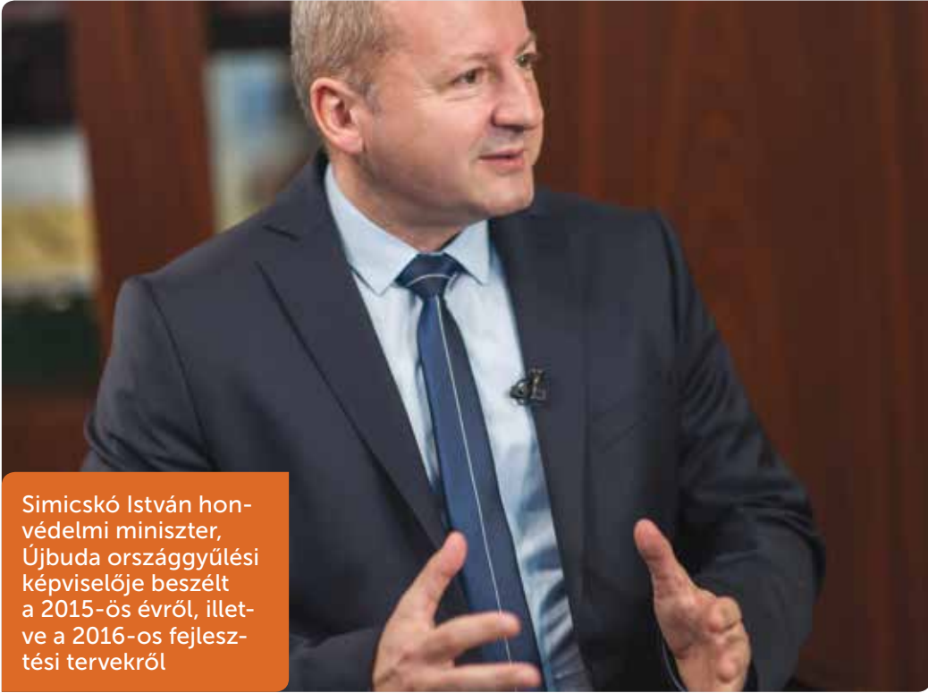
Simicskó István honvédelmi miniszter, Újbuda országgyűlési képviselője beszélt a 2015-ös évről, illetve a 2016-os fejlesztési tervekről

Jelentős források vannak, amelyekért keményen meg kell küzdeni, hiszen a kormányúléseken rendre felszínre kerülnek a különböző térségek érdekei. A kormány eldöntötte, hogy több, különböző városfejlesztési programot is