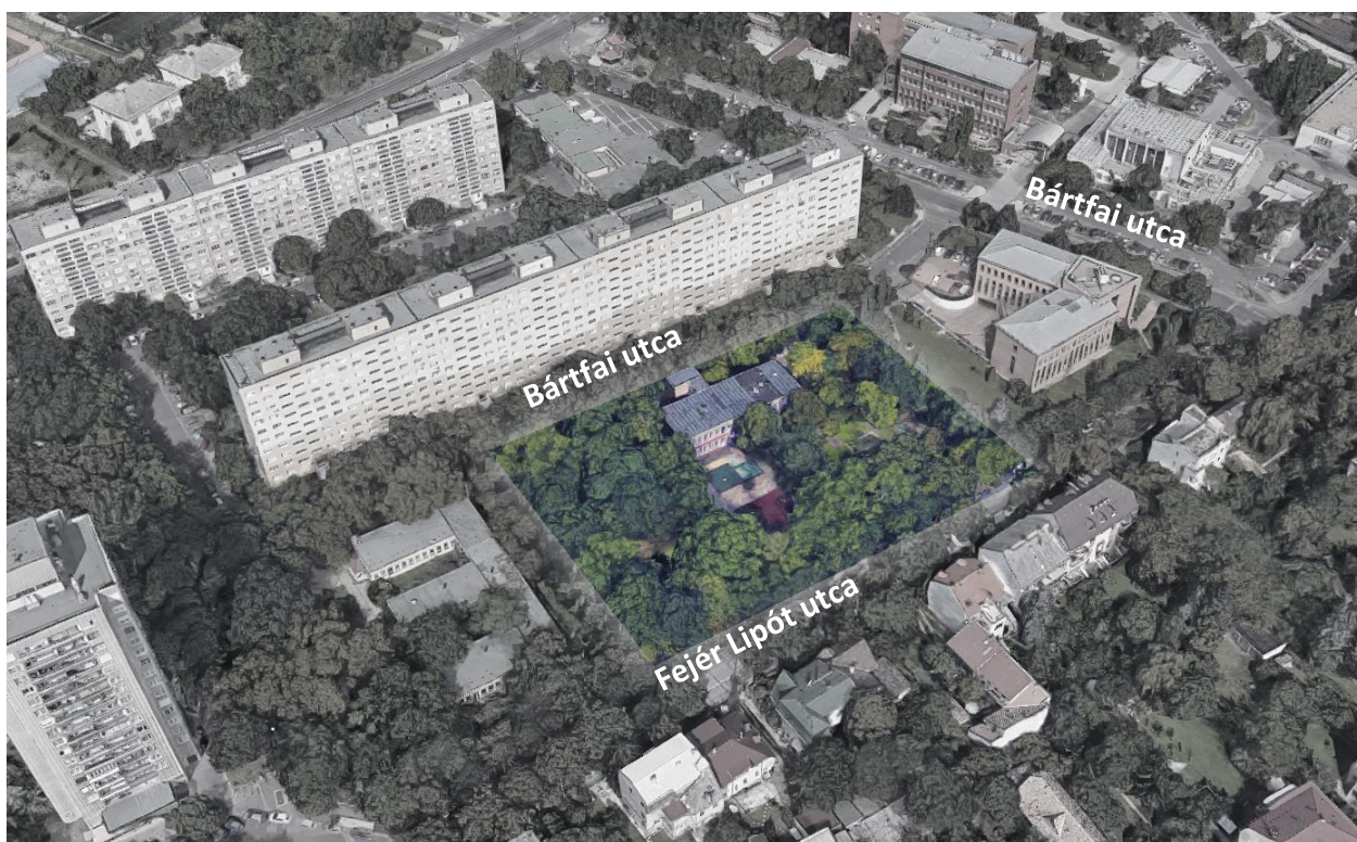
Az érintett 3533/20 hrsz.-ú telek a Bártfai utca és a Fejér Lipót utca által közbezárt tömbben

Az általánosan jó szerkezeti állapotú F+1 szint magas épület azonban az évek során (főként víz- és hőszigetelési szempontból) amortizálódott, a műszaki beavatkozás elkerülhetetlenné vált. A műszaki állagromlás megállításaival párhuzamosan azonban a funkcionális és üzemeltetői igények is megfogalmazódtak, miszerint szeretnék több gyermek ellátását biztosítani, kulturáltabb és racionálisabb körülmények között. Ennek megfelelően így nem csak pusztán energetikai és állagmegóvási munkák, hanem egy komplex bővítési-, átalakítási-, energetikai és "arculatváltási" terv tud megvalósulni.