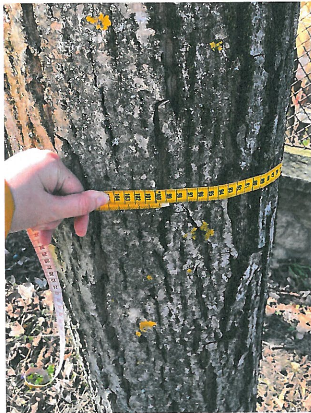
2. sorszámú közönséges dió