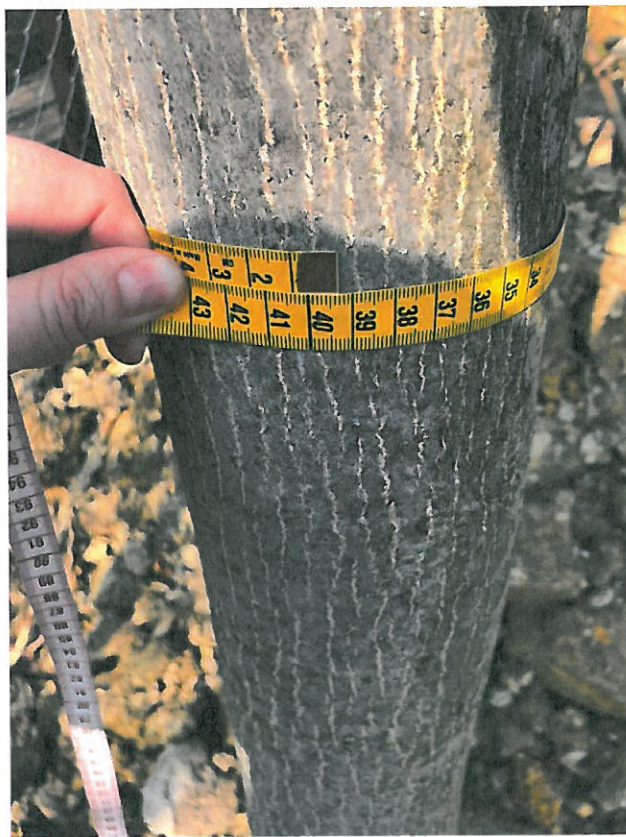
1. sorszámú közönséges dió