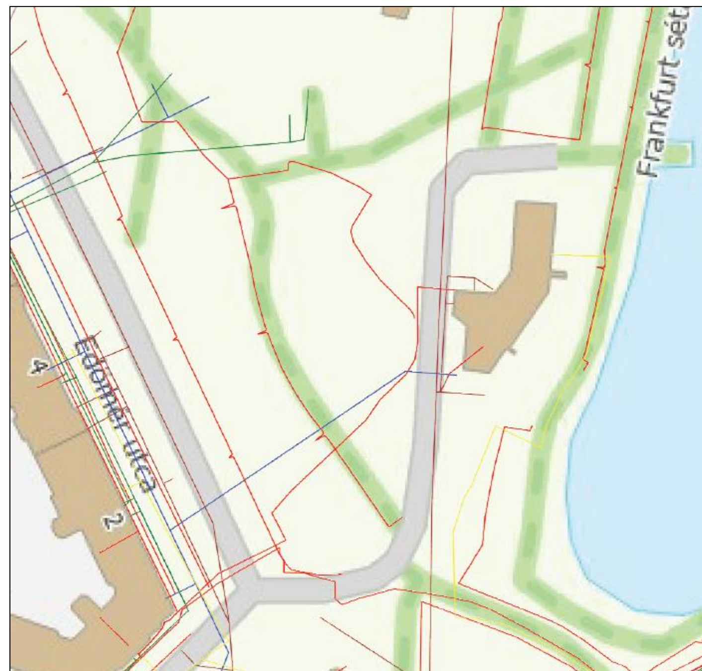
„Törőcsik Mari színművésznő XI. kerületi emlékhelyének megtervezése” pályázat