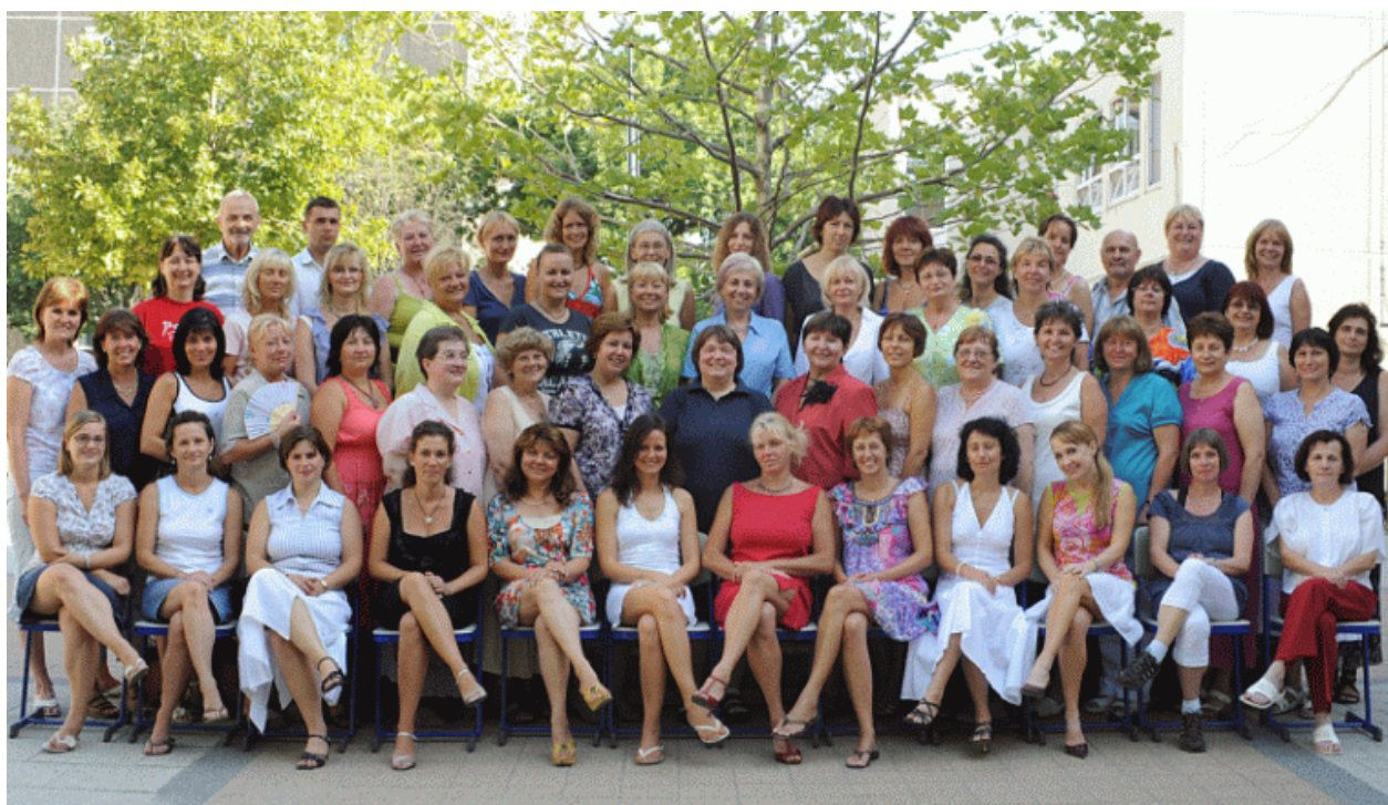
a 2011/2012-es tanévről